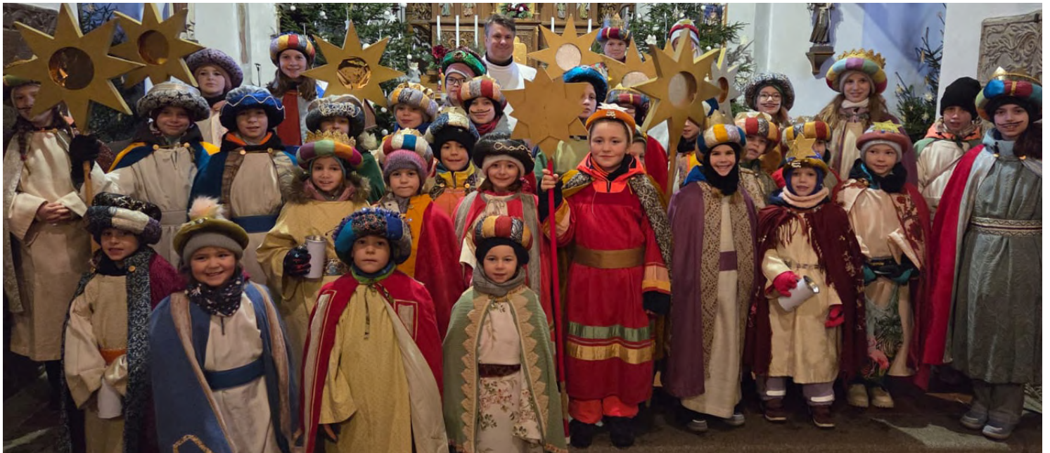
Ein herzliches Dankeschön gilt den Sternsängern für ihren fleißigen Einsatz am 2. und 3. Jänner 2026.