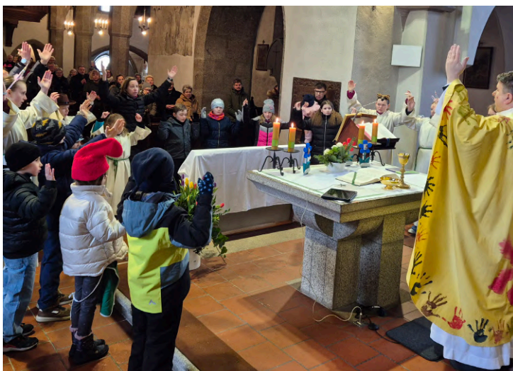
Faschingsfamilienmesse am 15. Februar 2026.