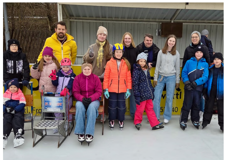
Eislaufnachmittag der Minis am 22. Februar in Zwettl.